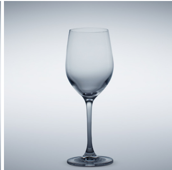
b 15 Chardonnay 340 ml | 210 mm