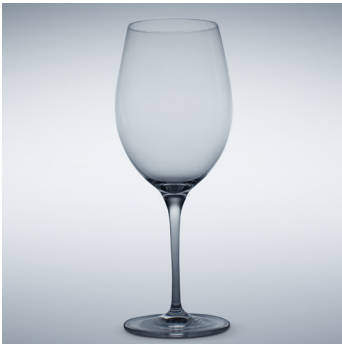
b 01 Bordeaux 620 ml | 240 mm