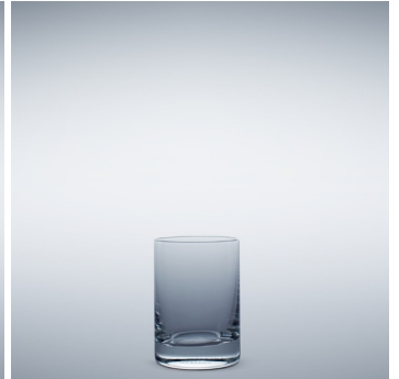
b 12 Water klein 135 ml | 84 mm