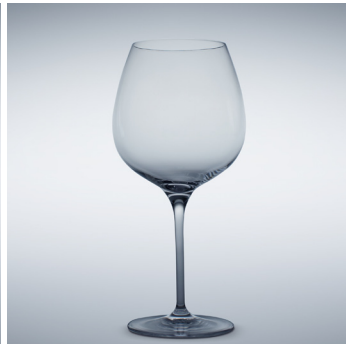
b 02 Burgunder 700 ml | 224 mm