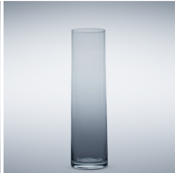
b 14 Bierstange 415 ml | 210 mm