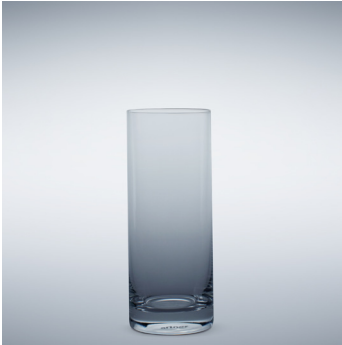
b 09 Highball 460 ml | 169 mm