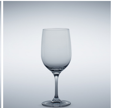
b 04 Water 320 ml | 185 mm