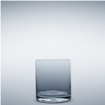
b 13 Whisky 480 ml | 102 mm 300 ml | 87 mm; 250 ml | 80 mm