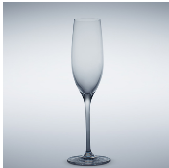
b 06 Sparkling 180 ml | 229 mm