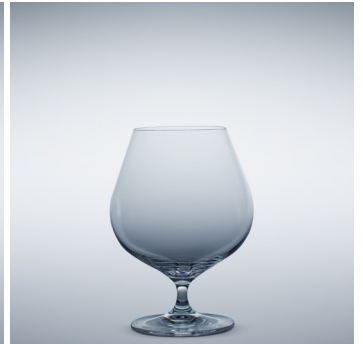
b 16 Cognac 780 ml | 156 mm