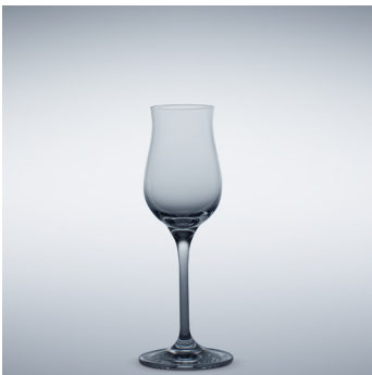
b 05 Digestive 125 ml | 182 mm