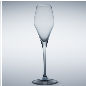
b 07 Cava 215 ml | 244 mm